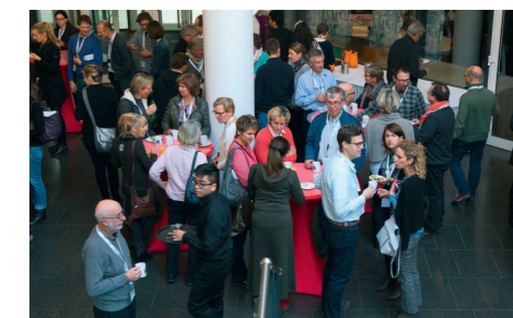
Kollegiale Diskussionen in den Kongresspausen